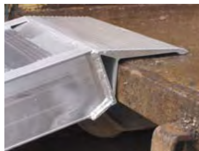
Surface de roulement