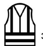
EN ISO20471 Classe 3