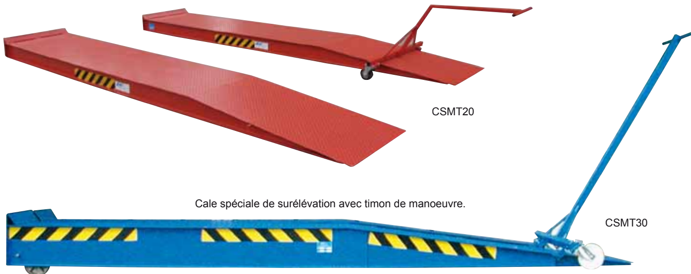
Cale spéciale de surélévation avec timon de manoeuvre.

Les cales de surélévation acier de grandes dimensions permettent le réhaussement de tous types de véhicules. Leur mise en place est faite par un timon amovible à roulettes. L'ensemble est facilement déplaçable.